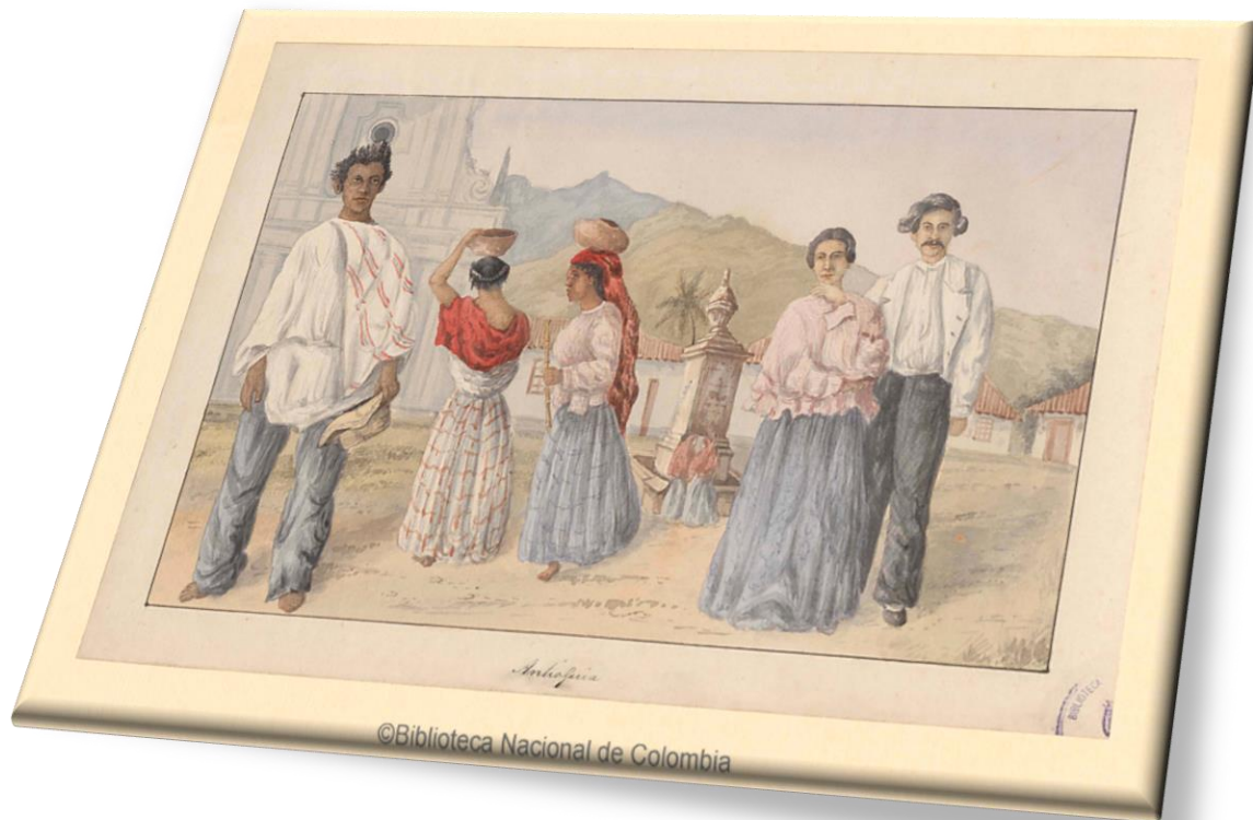
Plaza de Santafé de Antioquia. Henry Price, 1852. Comisión Corográfica Biblioteca Nacional de Colombia.

Su religiosidad y amor a la familia van de la mano con sus mitos y narraciones fantásticas a través de las cuales explican el mundo y su historia.