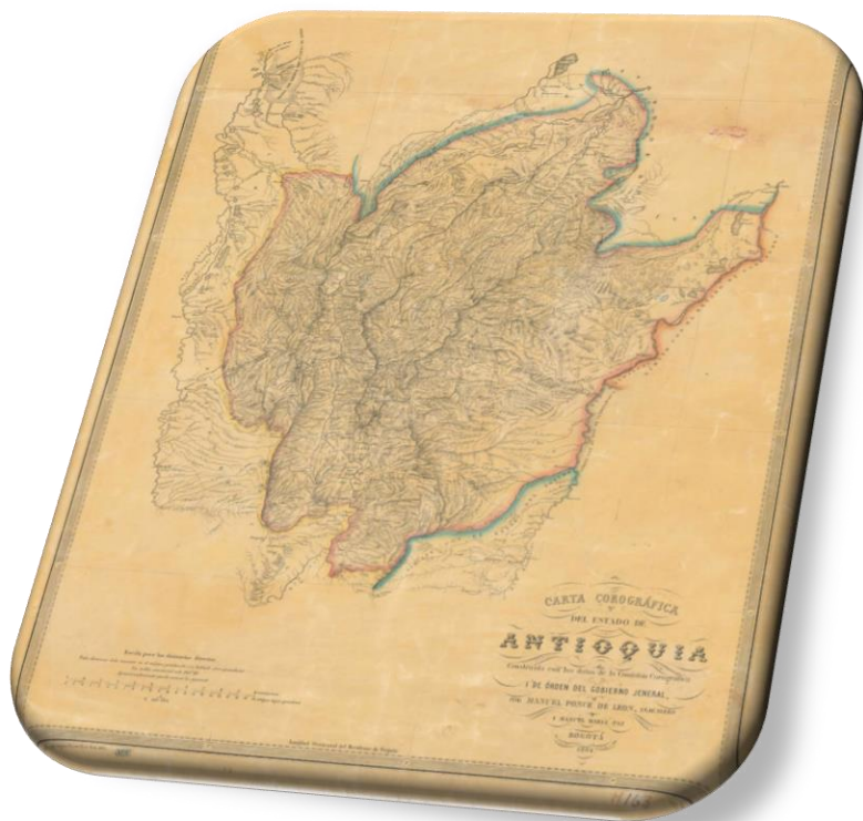
Carta corográfica del estado de Antioquia, construida con los datos de la Comisión Corográfica i de orden del gobierno jeneral, 1864. Banco de la República.

Durante el mes de agosto, Antioquia celebra su fecha de independencia, aquella que proclamara don Juan del Corral un 11 de agosto de 1813. Después de más de 200 años de independencia el departamento y su capital han vivido un proceso de desarrollo que inicia con la colonización antioqueña, el auge del cultivo del café, la labor incansable de arrieros que abrieron los primeros caminos y que luego los primeros ingenieros, formados en la escuela de minas, llevaron a cabo en obras como el túnel de la quiebra, que permitió desarrollar un sistema férreo -para entonces el más eficiente del país- y que permitió al departamento avanzar en su desarrollo industrial dando origen a importantes empresas nacionales que todavía juegan un papel importante en la economía nacional.