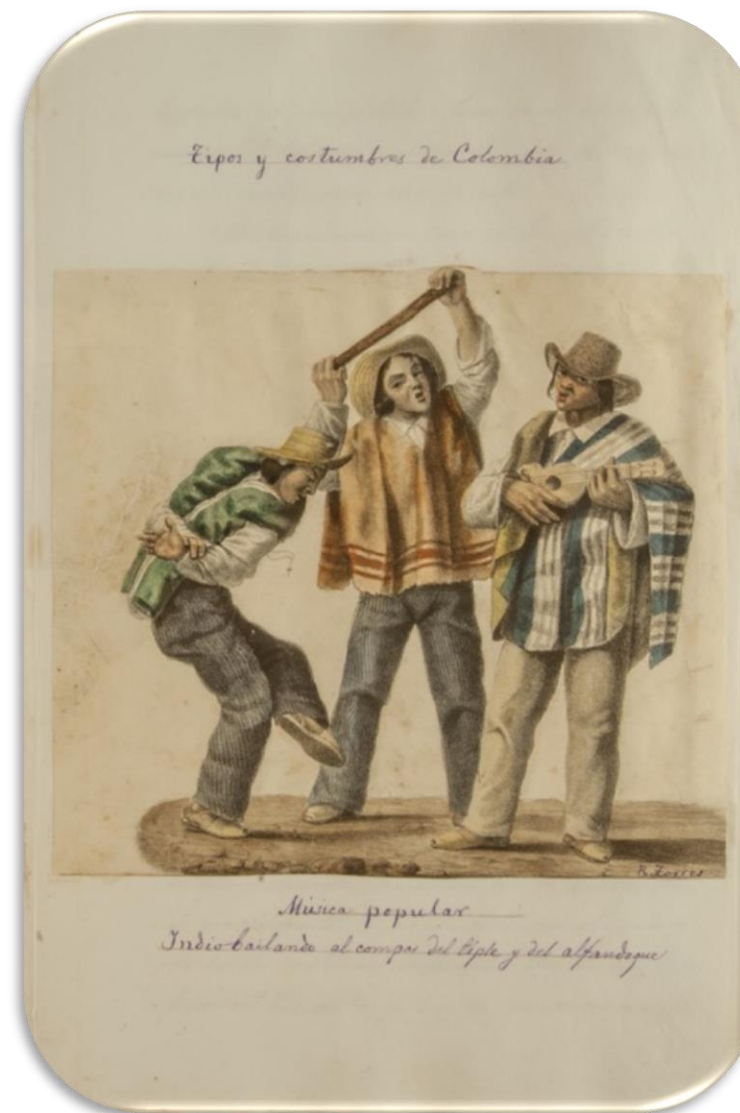
Torres Méndez, Ramón Título original: "El Tiple". Litografía de Martínez y Hermano. 1849 Litografía iluminada a la acuarela 16,8 x 18,8 cm Banco de la República

En sus fiestas tradicionales se aprecia su cultura musical: el tiple, la guitarra, la trova, la copla, la música de carrilera y la música andina forman parte de su folclore musical.